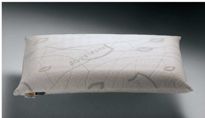
⊕ Guanciale Delicato

Bodyform: è un'innovativa schiuma visco-elastica termosensibile, anallergica ed automodellante. Questo materiale è indicato alle persone sensibili alle variazioni di temperatura , che amano dormire sul morbido. Il guanciale Delicato, infatti, aumenta sensibilmente il comfort, aiutando il corpo a rilassarsi e rigenerarsi: grazie agli speciali alveoli passanti, inoltre, il cuscino assicura la massima traspirabilità disperdendo l'umidità, mentre le innovative microcapsule Schoeller®-PCM™ regolano il calore in eccesso garantendo una resa termica sempre ottimale.