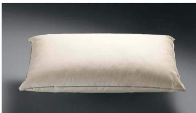
⊕ Guanciale Aliseo

Fibra: molto elastica, anallergica e inattaccabile da tarme e microrganismi, ha una struttura a ricciolo che conferisce ai guanciali una straordinaria elasticità e una resilienza costante nel tempo. L'aria che si forma tra le sferette di fibra assicura comfort e ha un'immediata e costante azione termoregolatrice . Aliseo è il guanciale studiato per chi vuole un cuscino dall'altezza personalizzabile, perché permette di variare con un semplice gesto la quantità di imbottitura.