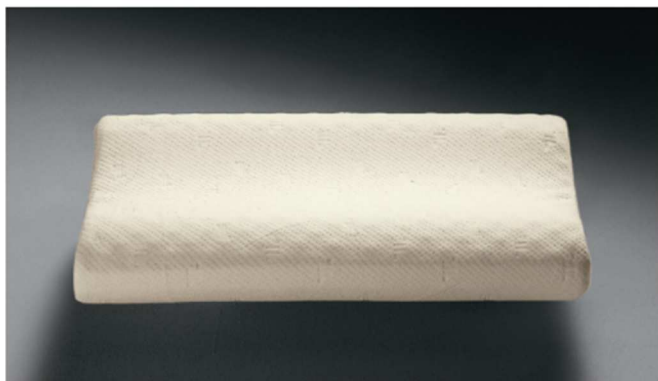
⊕ Guanciale Aurora

Aquapure: anallergico e molto elastico, questo materiale previene i dolori posturali e muscolari grazie alle particolari bugne che massaggiano il collo mentre si dorme e garantiscono la massima traspirabilità. Il cuscino Aurora ha una forma anatomica che sostiene le vertebre cervicali e il rivestimento in tessuto trattato con Aloe Vera, che aiuta a rilassarsi.